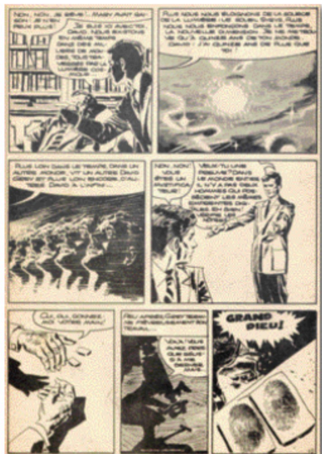
Ci-dessus, une planche de L'homme qui se rencontra lui-même , une excellente histoire fantastique où brille le talent d'Uggeri