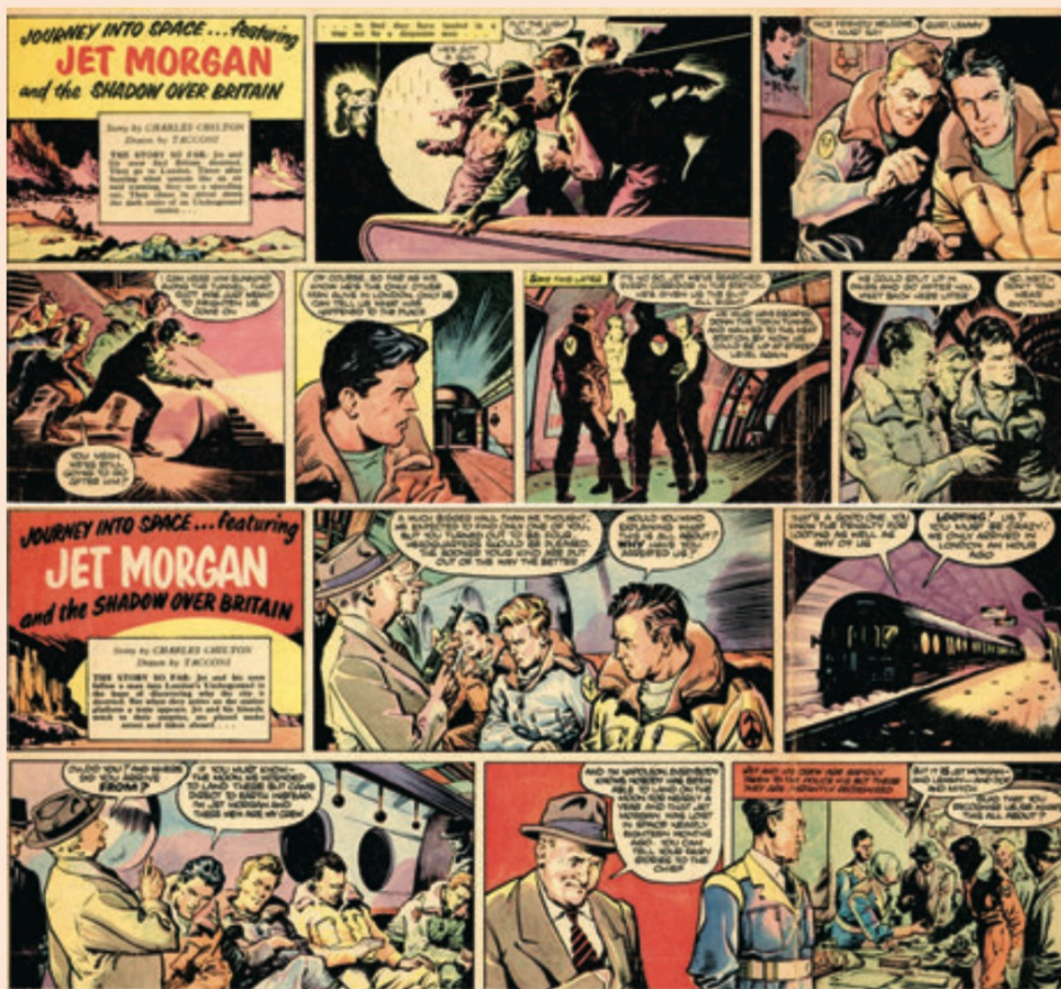
EXPRESS WEEKLY (16 février 1957)