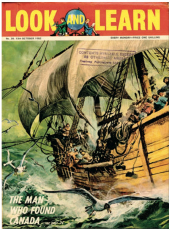
LOOK AND LEARN n° 39 (13 octobre 1962)