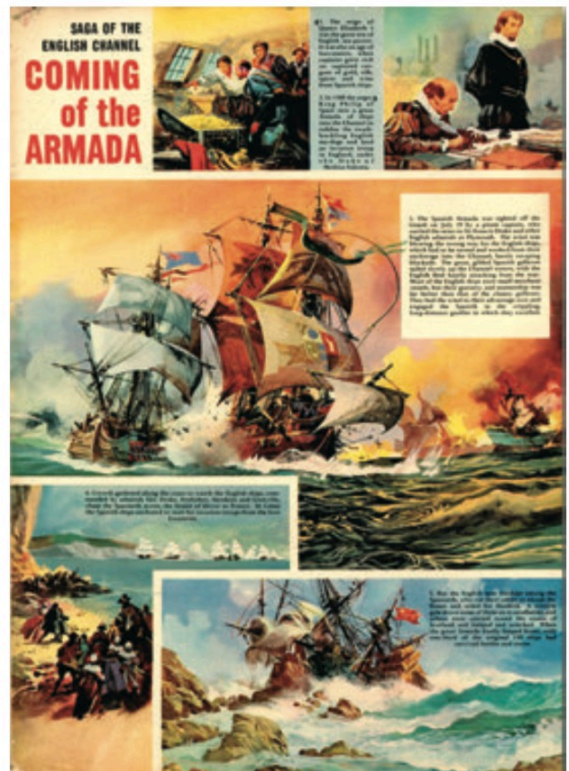
LOOK AND LEARN n° 84 (24 août 1963)