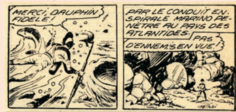
Marino le garçon des abîmes : SUPER BOY n°86