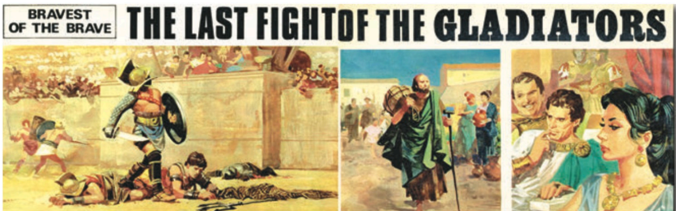
TELL ME WHY n° 4 (21 septembre 1968)