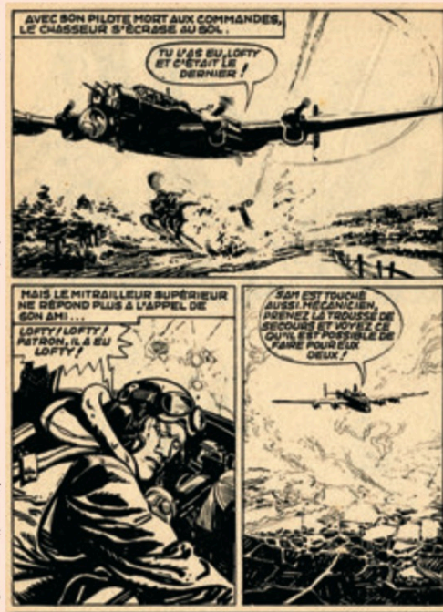
RAPACES n°115 - La 60 e mission