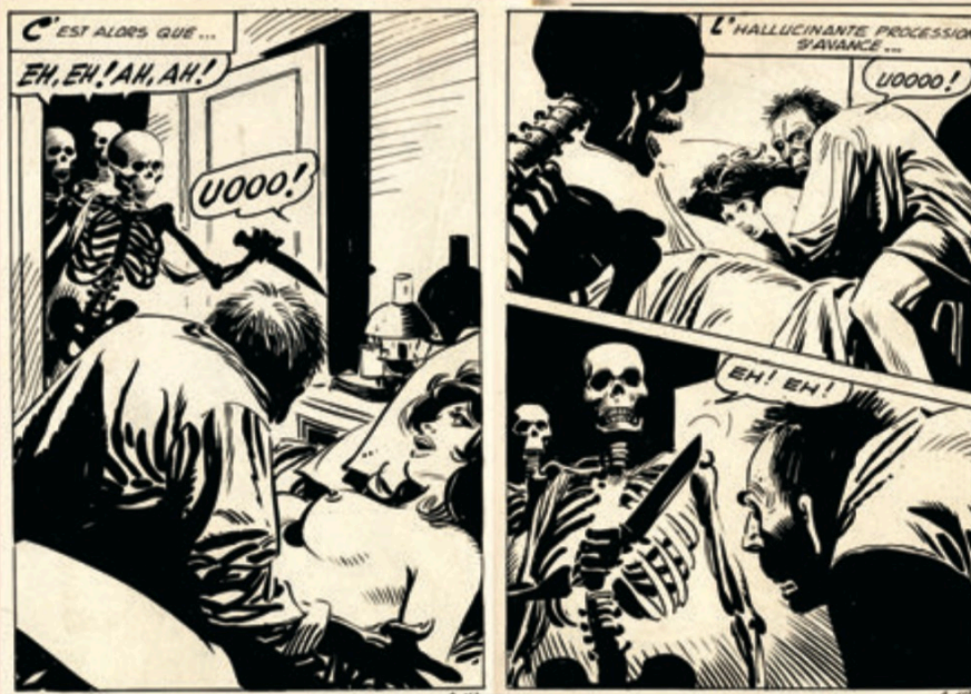
TERROR n°9 - La maison des squelettes

Il faut noter que Tacconi est l'un des rares auteurs du genre à être capable de fournir à la fois des récits intérieurs en noir et blanc et des couvertures en couleurs directes, d'un trait toujours élégant et raffiné.