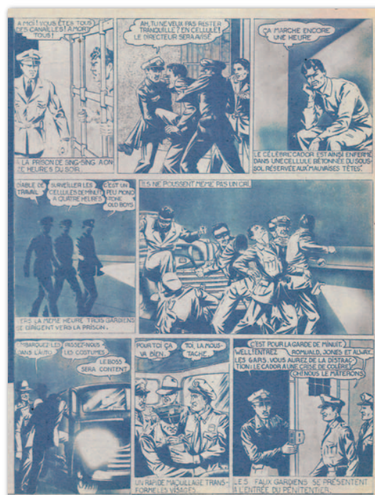
Le Cador : première planche, parue dans TOM'X n°19

La série sera interrompue, la raison invoquée par l'éditeur étant le manque de papier.