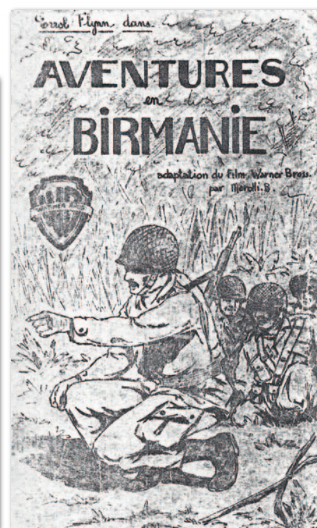
Aventures en Birmanie