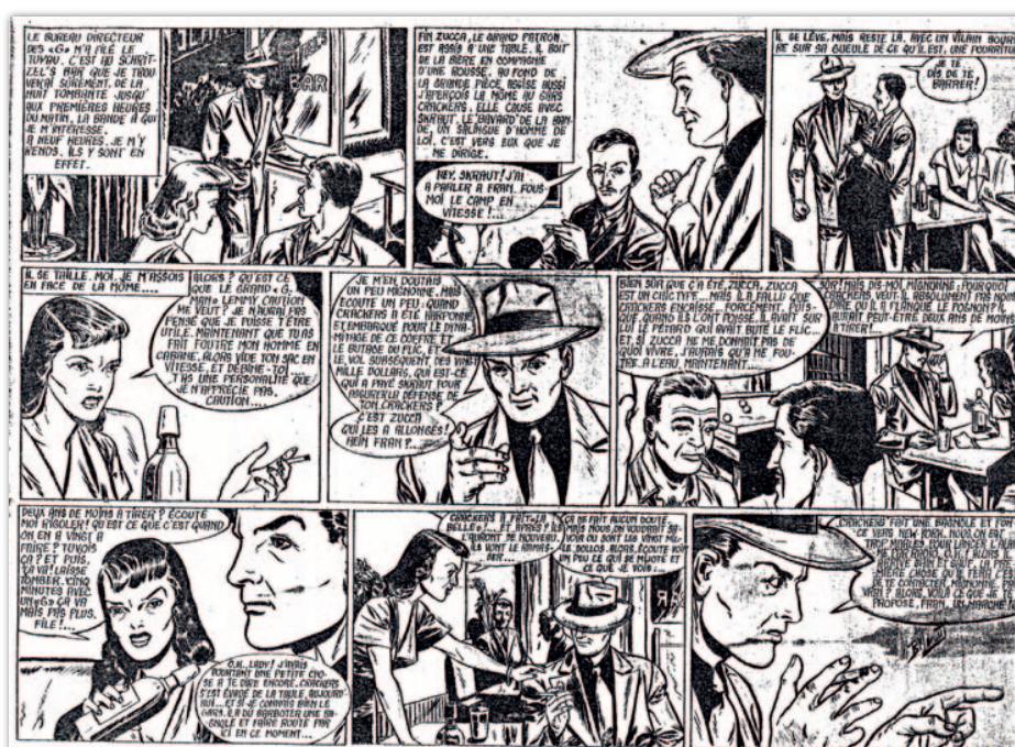
Une adaptation de « Lemmy Cauton » d'après un roman de Peter Cheyney (inédit)

Une anecdote qu'il nous a racontée : le 27 mai 1984, il participe à l'émission de Jacques Martin : « Si j'ai bonne mémoire ». Il remporte le jeu et gagne un voyage de 17 jours aux États-Unis !