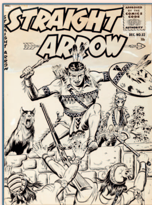
Un original de couverture

C'est avec le numéro 1 de PRAIRIE, publié par Impéria en décembre 1951, que ce dessinateur apparaît en France, avec son héros indien Straight Arrow , traduit sous le nom de Flèche Loyale . Il provient d'un comic-book de Magazine Enterprises paru sur 55 numéros de février-mars 1950 à mars 1956 et il reste le personnage le plus marquant de sa carrière.