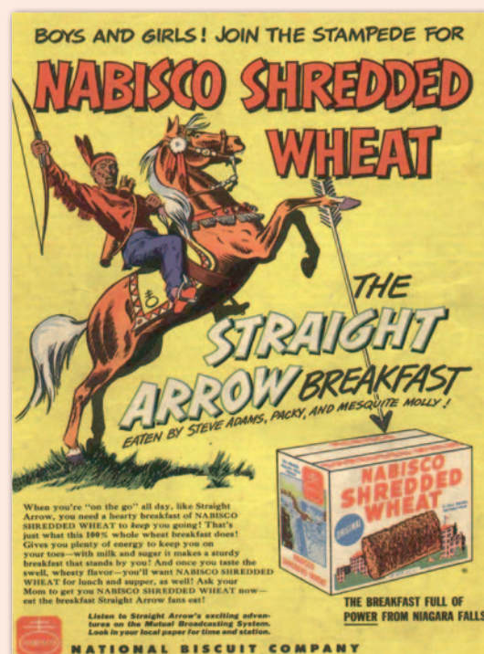
Straight Arrow était sponsorisé par Nabisco

Fred Meagher a dessiné trois autres westerns :