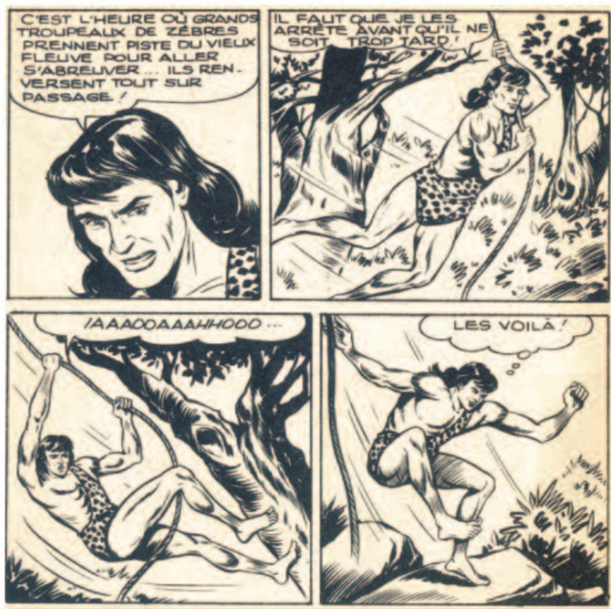
Zembra (ZEMBLA n°5)