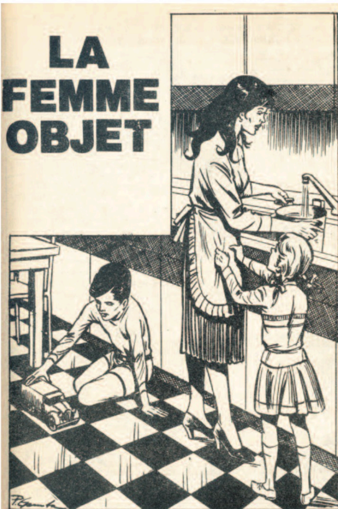
Un récit érotique avec la signature de Gamba (HORS SÉRIE NOIRE n°35)