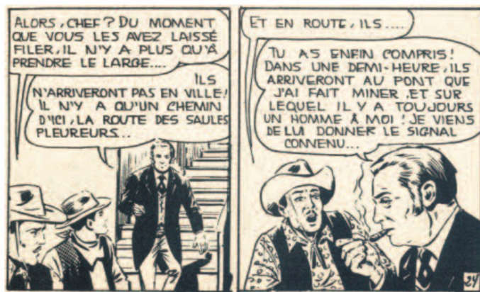
La route des Saules (FOC n°4, réédité dans ZORA n°48) Récit complet paru dans l'INTREPIDO n°50 (1963)