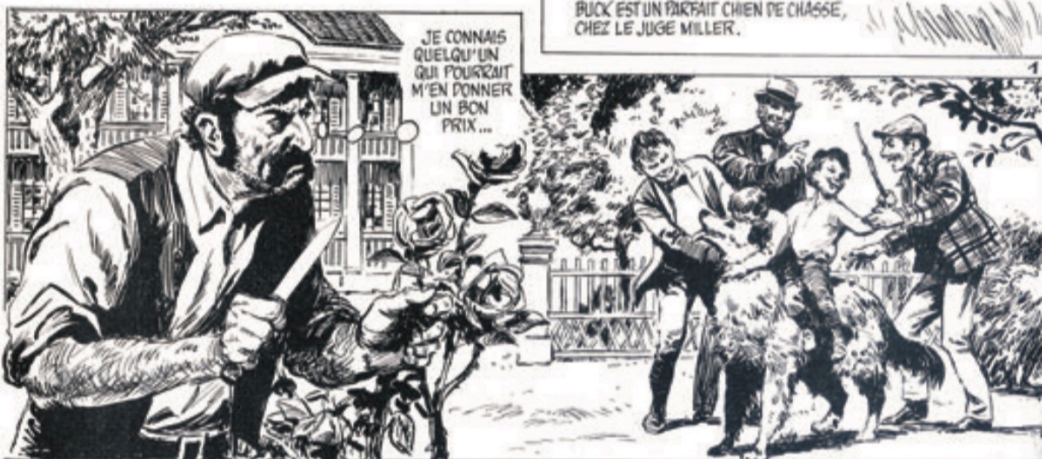
Jack London en BD par Cecil Doughty : L'appel de la forêt , paru dans SPIROU ALBUM + n° 4 de décembre 1982