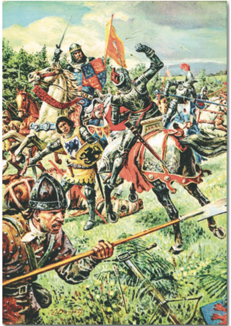
LOOK AND LEARN n° 129 (4 juillet 1964)