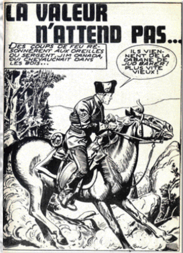
Quelques exemples de la qualité du trait de Sergio Tarquinio