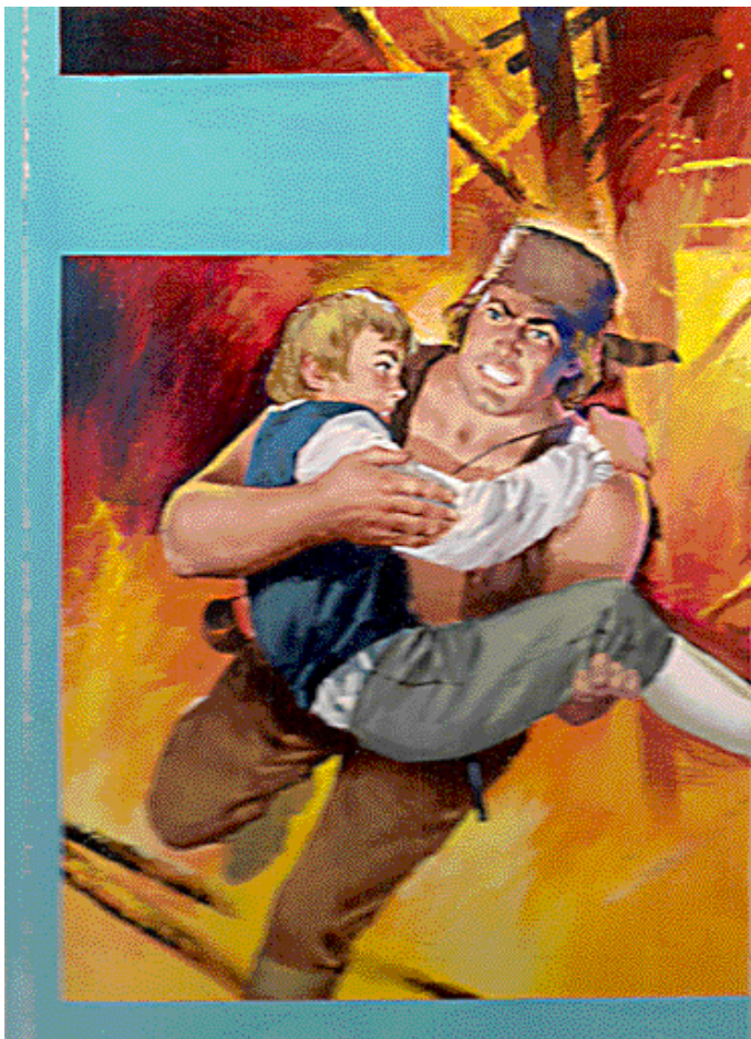
Projet de couverture du BLEK n°1 (inédit)