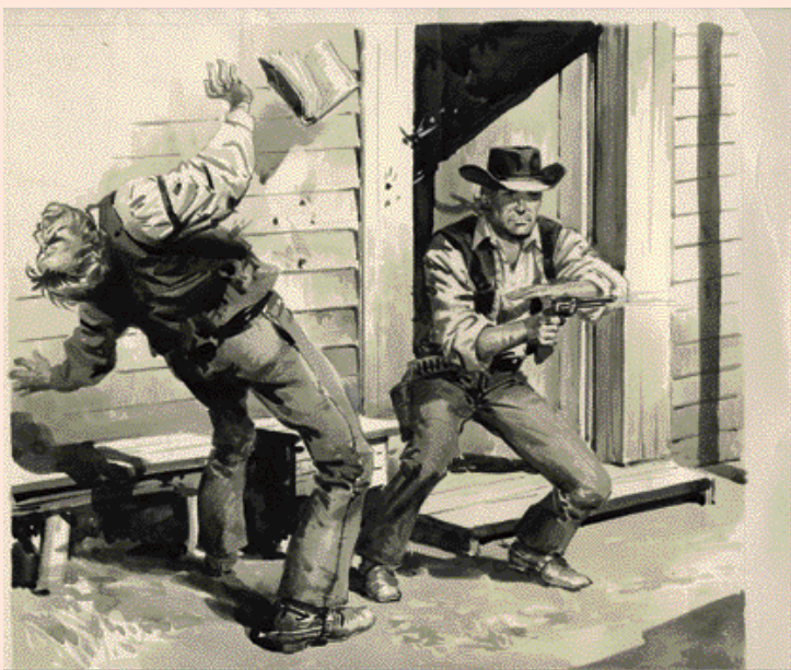
Une couverture non utilisée par les éditions LUG

Dans le même esprit, Mairani a aussi travaillé pour LUNA PARK avec deux romans au lavis et des couvertures.