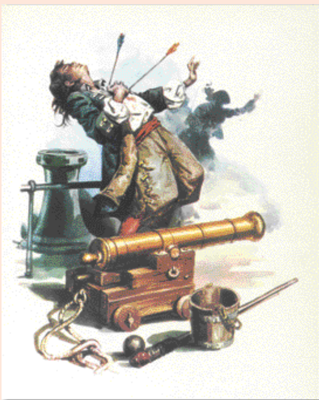
Une illustration pour « Les aventures de Robinsone Crusoe »