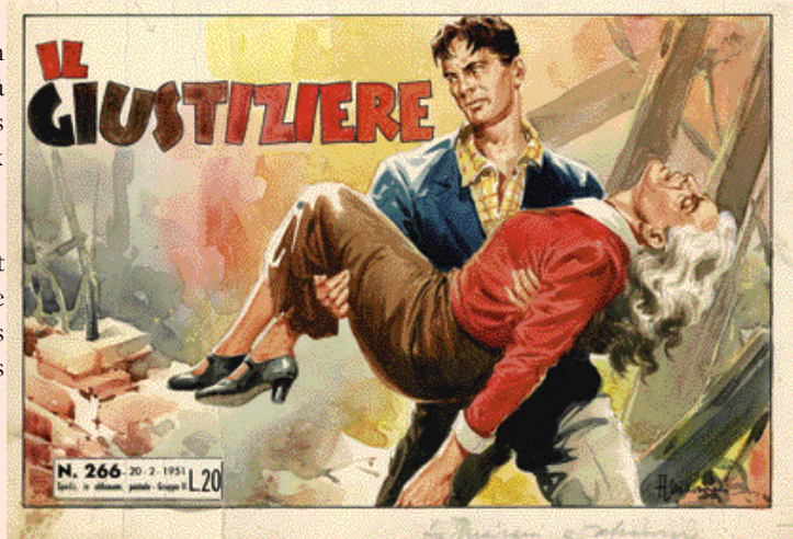
Original de couverture pour un récit complet de L'INTREPIDO